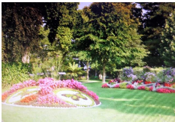
Jardin des Plantes de COUTANCES